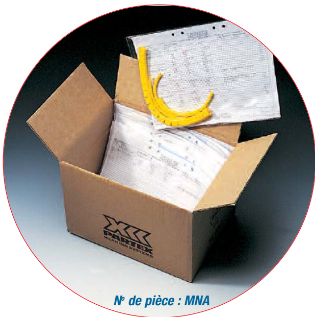
N° de pièce : MNA

Marqueurs non triés, en boucle, numérotés séquentiellement selon l'entrée des données dans le fichier Excel du client