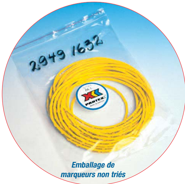
Emballage de marqueurs non triés

Marqueurs non triés, en boucle, numérotés séquentiellement selon l'entrée des données dans le fichier Excel du client